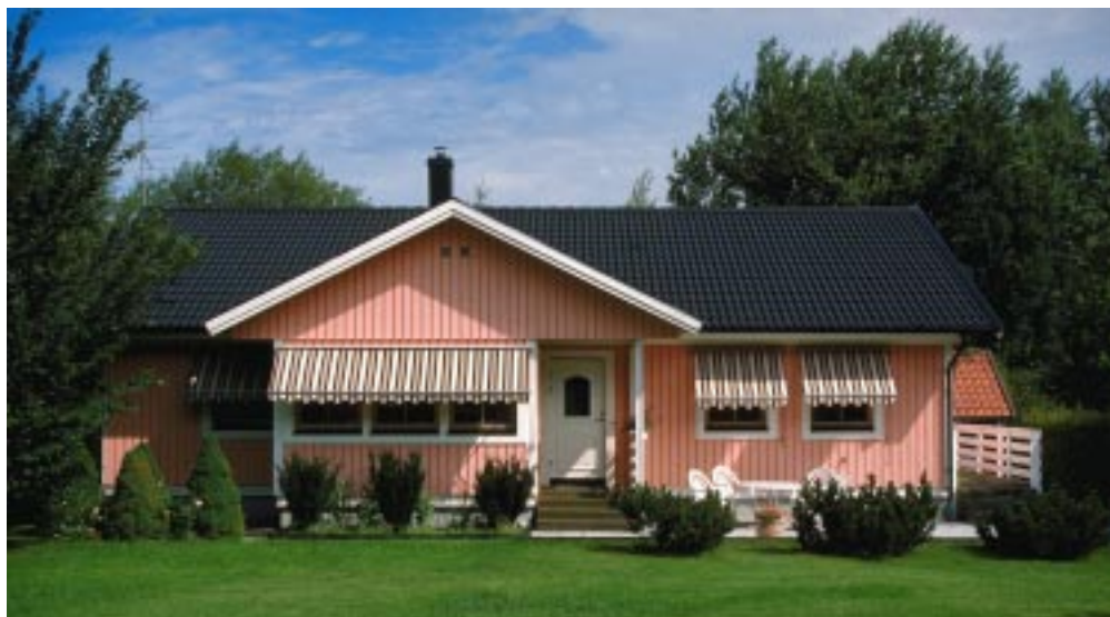
OBS! Huset på bilden har inget samband med texten i broschyren.