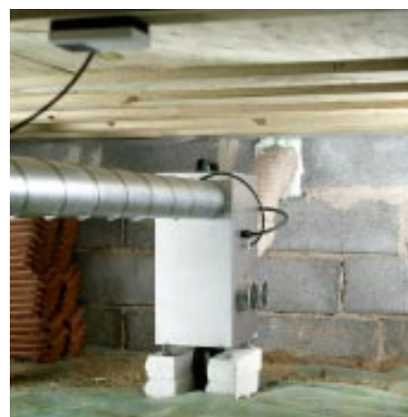
En avfuktare från Seibu Giken DST installerad i krypgrund. Avfuktaren kan även monteras hängande på väggen.

Varje krypgrund är unik, vilket innebär att installationen kommer att utformas lite olika från fall till fall. Teckningen ovan visar schematiskt hur en installation kan se ut. Fotot till höger visar en avfuktare från Seibu Giken DST installerad i en krypgrund.