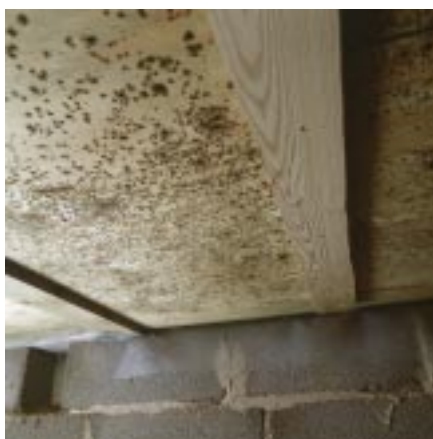
Mögeltillväxt på blindbotten i villa byggd 1991.

Där, mellan bjälklagret och marken, blir klimatet gynnsamt för mögelpåväxt. Resultatet kan bli dålig lukt i huset och "sjuka hus"-symptom. Ibland kan det t o m bildas röta i golvkonstruktionen, vilket leder till att konstruktionen försvagas och kan gå sönder.